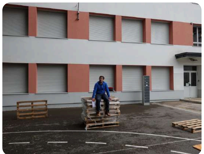
À La Ligne, L'été sera Lons (39) - juillet 2024