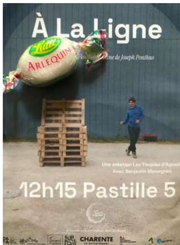
À La Ligne, Festival d'Aurillac (15) août 2024