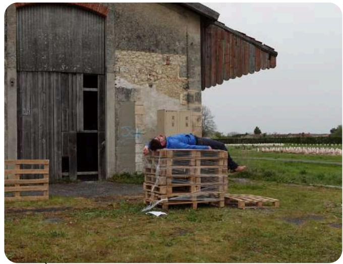
À La Ligne, Barbezieux (16) avril 2024

Première oeuvre de spectacle vivant des Toupies d'Agrado, À La Ligne est l'adaptation du roman de Joseph Ponthus ( À La Ligne, feuillets d'usine paru en 2019 aux éditions La Table Ronde) qui raconte son quotidien d'intérimaire à l'usine, d'abord dans une conserverie de poisson puis dans un abattoir.