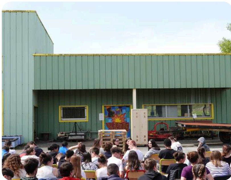
À La Ligne, Barbezieux (16) avril 2024

Maintenant que À La Ligne est créé, le spectacle continue sa route et nous élargissons sa diffusion afin de rencontrer d'autres publics et d'autres territoires. Cette histoire, avec son rapport simple, direct et intime évolue au gré des personnes rencontrées.