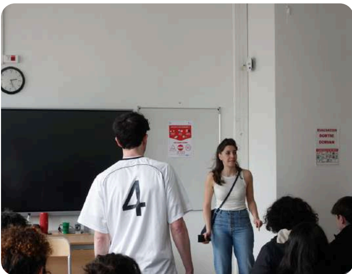
OUT Lycée Arago (75) - mars 2025

« Je tiens à vous remercier pour les pièces de théâtre forum que vous avez présentées dans notre établissement dans le cadre de la sensibilisation toutes les causes que vous défendez. Votre travail artistique a su allier émotion, justesse et pédagogie. A travers vos mises en scène vous avez su mettre des réalités parfois invisibles, freiner les stéréotypes et encourager l'ouverture d'esprit. Grâce à vous le message de tolérance, d'égalité et de respect est passé avec force et humanité. Votre engagement est essentiel, surtout à une époque où chaque voix compte pour construire une société plus inclusive et solidaire. Sachez que votre passage parmi nous a marqué les esprits. Encore un grand merci pour ce moment de réflexion et d'émotions. Avec tout mon respect et ma gratitude. »