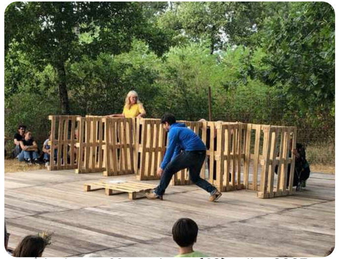
À La Ligne, Musicalarue (40) juillet 2025

Première oeuvre de spectacle vivant des Toupies d'Agrado, À La Ligne est l'adaptation du roman de Joseph Ponthus ( À La Ligne, feuillets d'usine paru en 2019 aux éditions La Table Ronde) qui raconte son quotidien d'intérimaire à l'usine, d'abord dans une conserverie de poisson puis dans un abattoir.