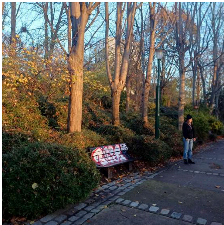
Ces Gens-Là, Belleville (75) novembre 2025

L'action artistique CEPS (menée avec les élèves du LPA de Barbezieux sur l'agriculture) a fait naître le désir d'écrire une comédie rurale en espace public.