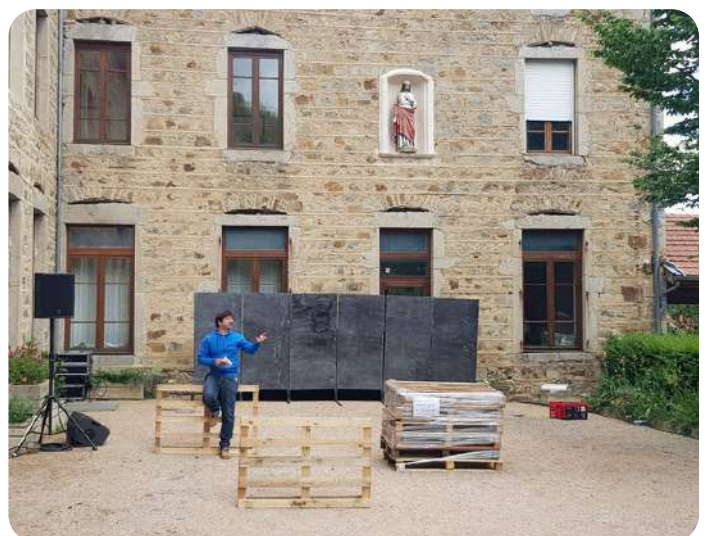
Monts de la Balle Verrières-en-Forez (42) - juin 2025