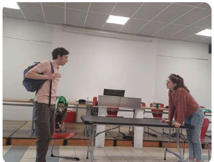
OUT Lycée Charles Coulomb (16) - février 2025