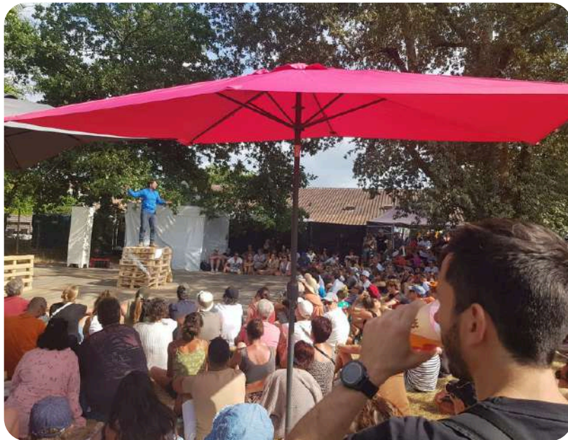
À La Ligne, Musicalarue (40) juillet 2025

Maintenant que À La Ligne est créé, le spectacle continue sa route et nous élargissons sa diffusion afin de rencontrer d'autres publics et d'autres territoires. Cette histoire, avec son rapport simple, direct et intime évolue au gré des personnes rencontrées.